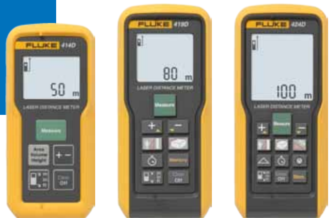
Fluke 414D, 419D en 424D laserafstandsmeters.

De laserafstandsmeters van Fluke maken gebruik van de meest geavanceerde technologie voor afstandsmetingen. Deze meters zijn snel, nauwkeurig, duurzaam en gemakkelijk in gebruik — gewoon richten en op de knop drukken. Dankzij hun ongecompliceerde ontwerp en simpele bediening met één knop bent u minder tijd kwijt met meten, terwijl de betrouwbaarheid van de antwoorden die u nodig hebt groter is.