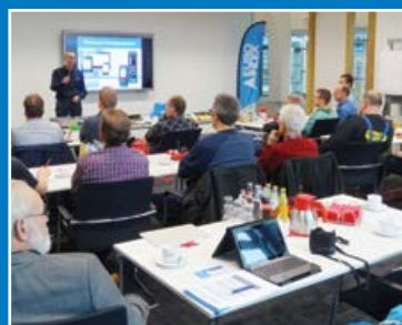
Seminars en workshops