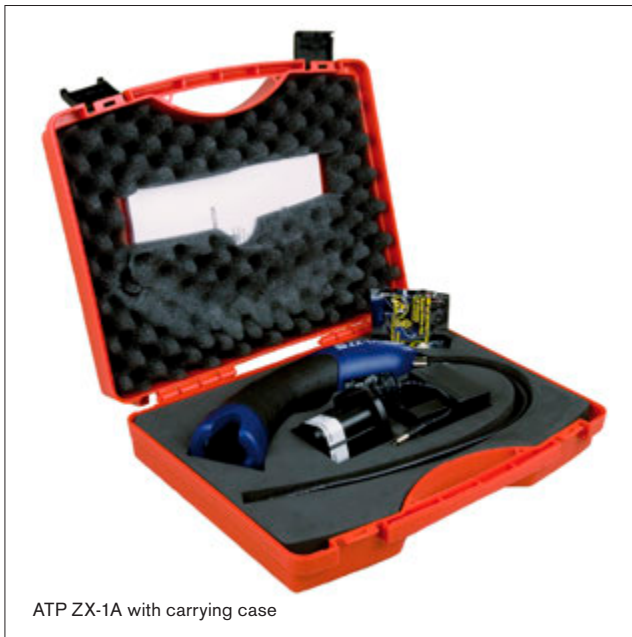
ATP ZX-1A with carrying case