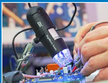
Onderhoud, reparatie en kalibratie