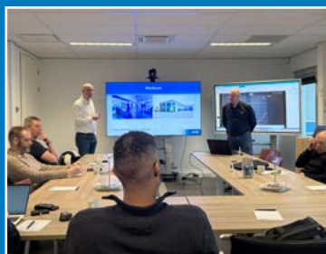
Cursussen en workshops