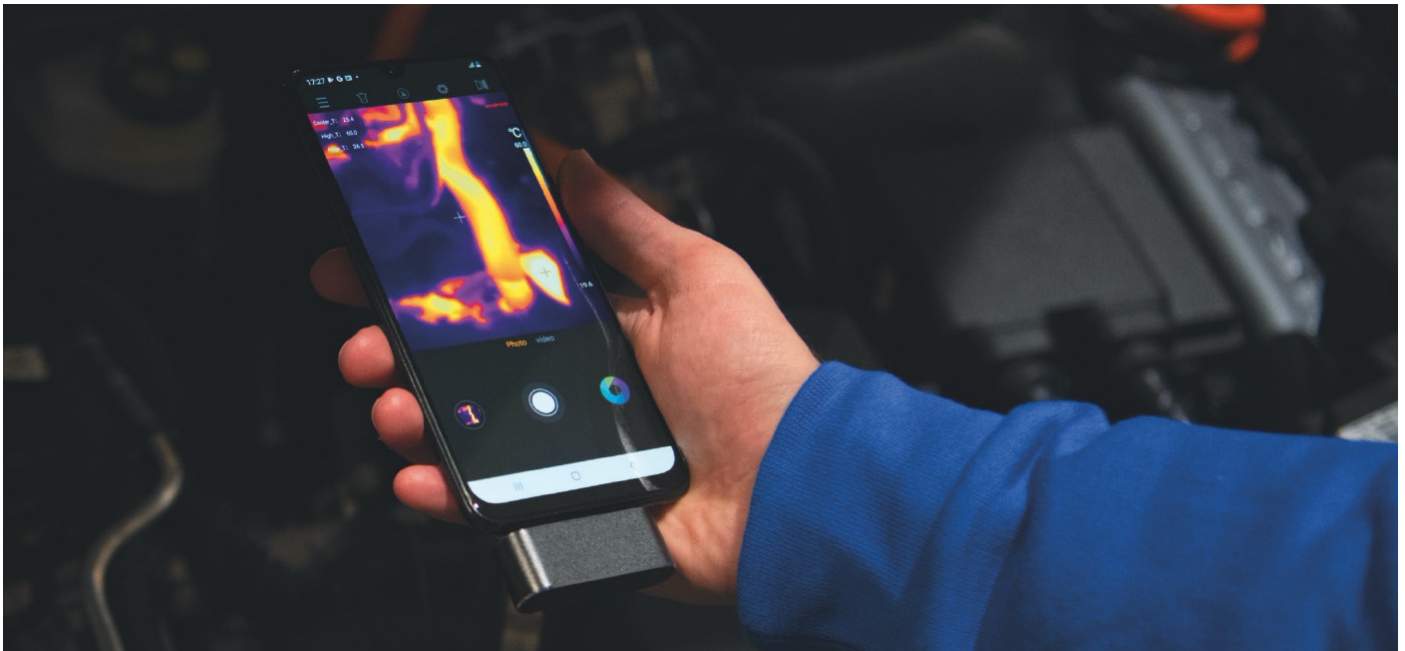
Connection of THT8 camera to a mobile device