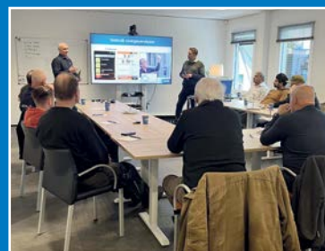
Cursussen en workshops