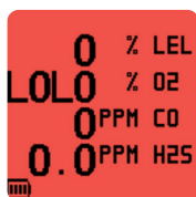
Rode display in alarmcondities