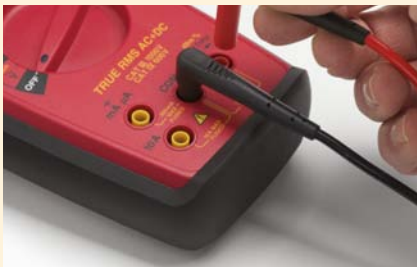
Universele stekkers die compatibel zijn met alle geïsoleerde 4mm-ingangen