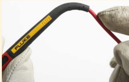
Extreem sterke trekbelasting getest tot ruim 30.000 buigingen