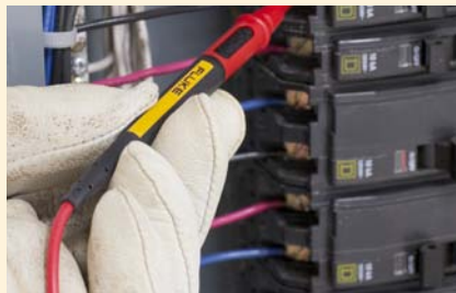
Verkleining van het blanke meetpenseel voor meten in CAT III