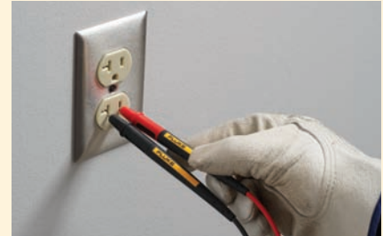
Verlenging van de meetpen voor meten in CAT II