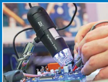
Onderhoud, reparatie en kalibratie