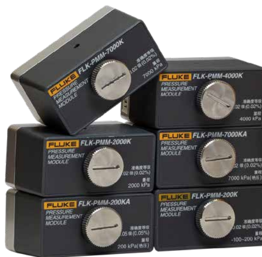
Afbeelding 1. Oplaadbare lithiumbatterij met capaciteitsindicatie.

HART-communicatie maakt het afregelen van het mA-uitgangssignaal, van toegepaste waarden en van het druknulpunt van HART-druktransmitters mogelijk. U kunt eenvoudig transmitter-tags, meeteenheden en bereiken wijzigen. Andere ondersteunde HART-opdrachten omvatten het instellen van vaste mA-uitgangssignalen voor storingzoeken, het uitlezen van de configuratie en parameters van apparatuur en het uitlezen van diagnosegegevens van apparatuur.