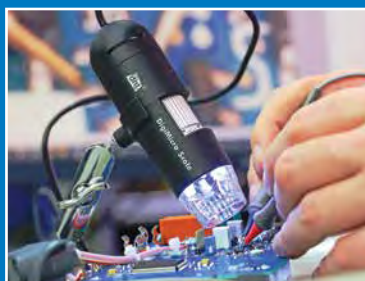
Onderhoud, reparatie en kalibratie