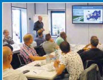
Cursussen en workshops