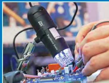
Onderhoud, reparatie en kalibratie