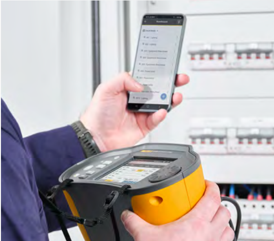
Verminder de handmatige gegevensinvoer en het bijhouden van de administratie