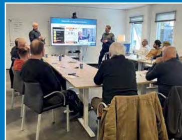
Cursussen en workshops