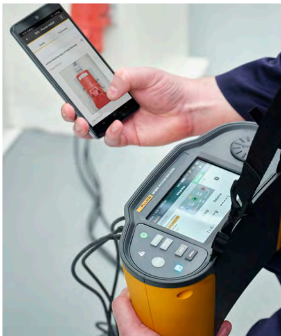
Wijs foto's rechtstreeks toe aan specifieke meetpunten voor meer gedetailleerde documentatie