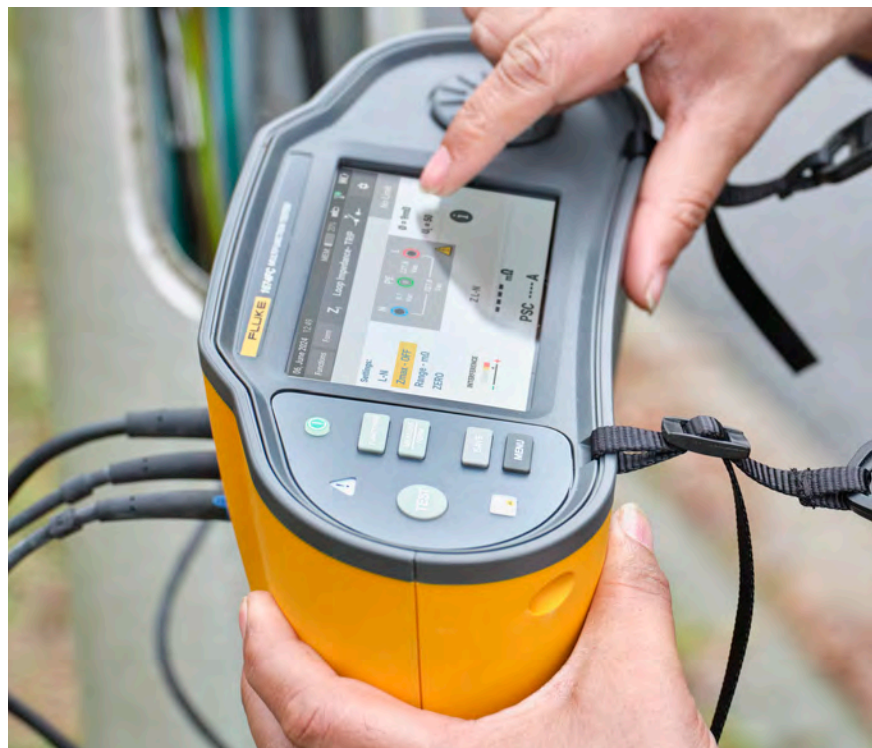
Kleurentouchscreen en tastbare draaiknop voor snelle navigatie

Met de 1670-serie kunt u uw vereiste tests sneller uitvoeren en de tijd die u besteedt aan documentatie verminderen, terwijl u volledig kan vertrouwen op de gegevens die u verzamelt.