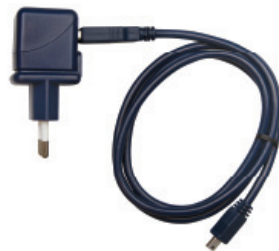
fig. 1: Lichtnetadapter

Sluit de lichtnetadapter (Fig. 1) aan op een wandcontactdoos en de Eurolyzer STx (Fig. 2). De Eurolyzer STx gaat vanzelf aan mocht deze uit staan.