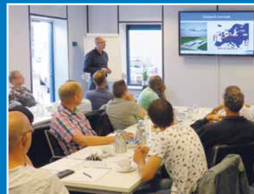
Cursussen en workshops