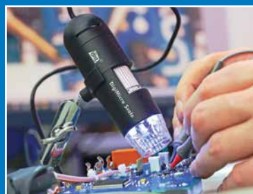
Onderhoud, reparatie en kalibratie