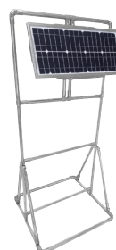
SolarPak oplaadapparaat (optioneel)