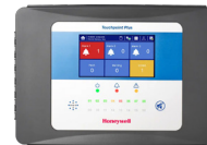
Honeywell Touchpoint™ Plus-controller