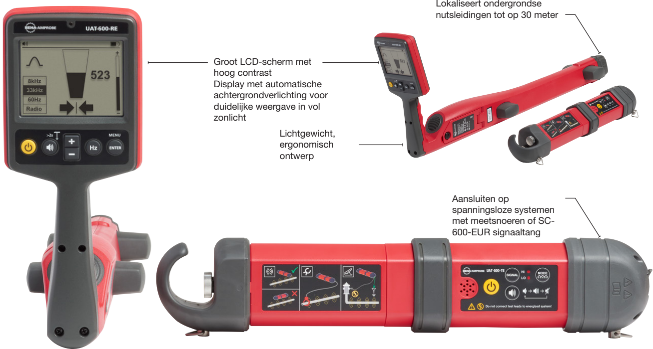
UAT-505-EUR Kit voor opsporen van ondergrondse nutsvoorzieningen