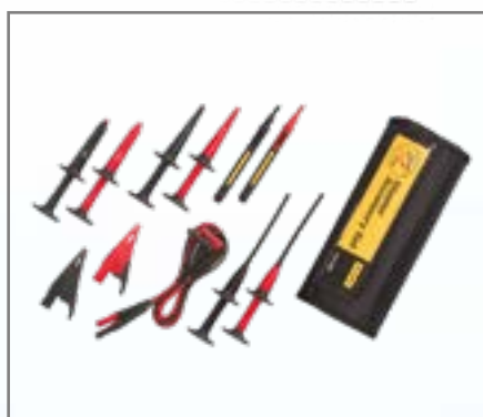
Fluke TLK-225 SureGrip™ Master-accessoireset

De Fluke TLK-225 SureGrip™ Master-accessoireset is de perfecte vervangingsset die flexibiliteit en comfort biedt, met alle SureGrip™-snoeren en -probes in een handige roltas met zes vakjes, samen met TL224-meetsnoeren.