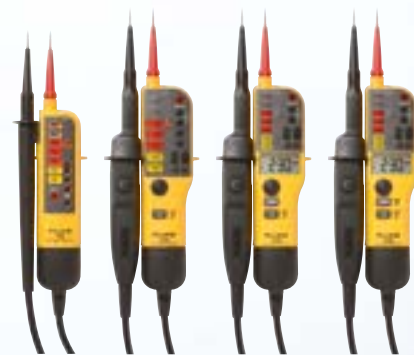
Snelle, veilige metingen