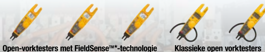
Open-vorktesters met FieldSense™-technologie