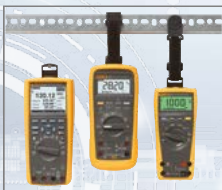
Fluke TPAK ToolPak™ Magnetische hangclip

Hang uw meter op verschillende manieren op om twee handen vrij te hebben.