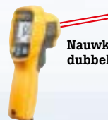
Nauwkeurige dubbele lasers