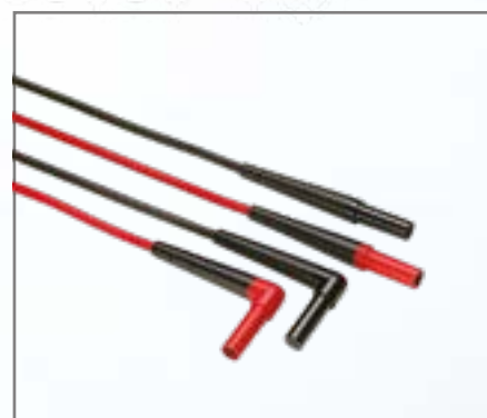
Fluke TL224 SureGrip™ Meetsnoeren met siliconenisolatie