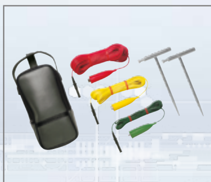
Fluke ES165X aardingspennen Meetset

De set maakt het mogelijk de aardingsweerstand eenvoudig te testen met behulp van 3 draden en hulpaardingspennen.